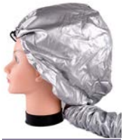
Gorro termico secador