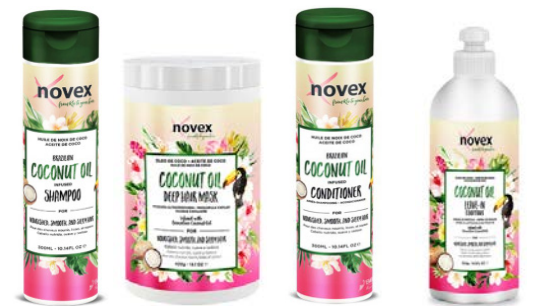
Champú 300ml Mascara 210g/400g/1kg Acondicionador 400ml Leave-in 300ml