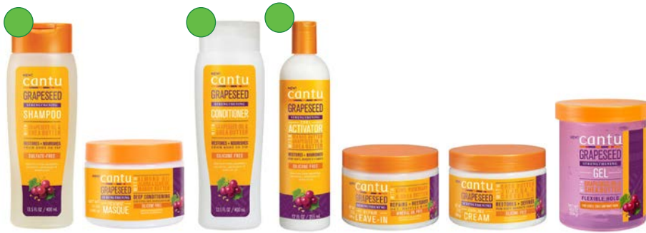
Champú 400ml Mascarilla 340g Acondicionador 400ml Activador de rizos 355ml Leave-in 340g Crema de peinado 340g Gel definidor 524g