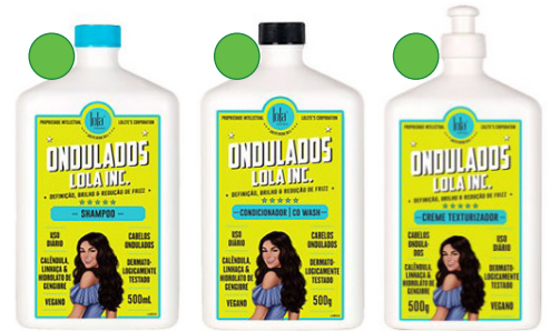
Champú 500ml Acondicionador 500g Crema de peinado 500g