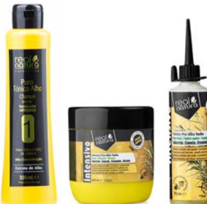
Champú 500ml Mascarilla 500ml Tónico 70ml