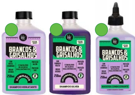
Champú hidratante 250ml Champú clarificante matizador 250ml Acondicionador 250ml