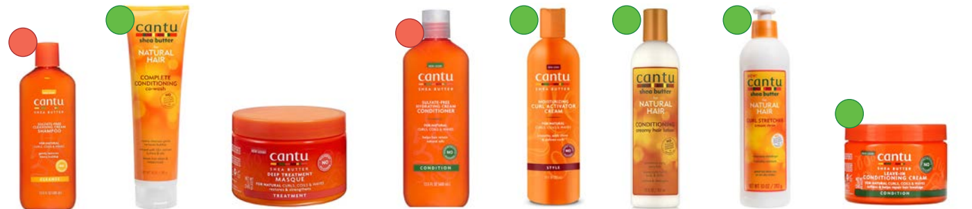
Champú 89ml/400ml/ 709g