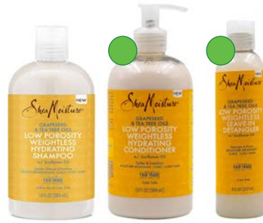
Champú 384ml Acondicionador 384ml Leave-in 237ml