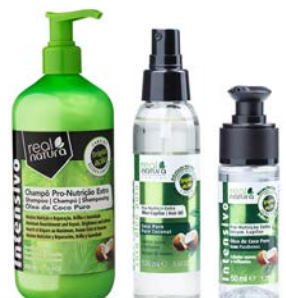
Champú 500ml Aceite 100ml Serúm 50ml