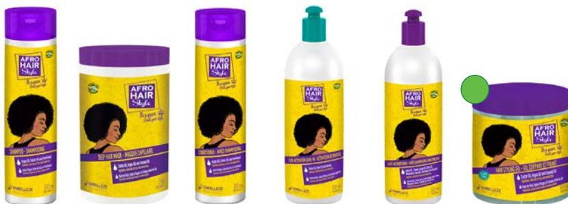
Champú 300ml Mascara 1kg Acondicionador 300ml Activador de rizos 500ml Leave-in 500ml Gel 500ml