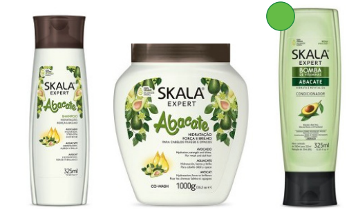
Champú 325ml Mascarilla 1kg Acondicionador 325ml