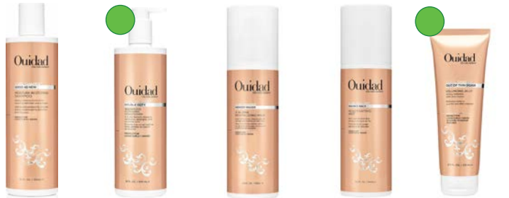
Champú 355ml Acondicionador 500ml/1l Leche de peinado 251ml Bruma refrescar 250ml Gel 251ml/65ml