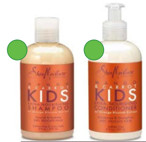
Champú 237ml Acondicionador 237ml