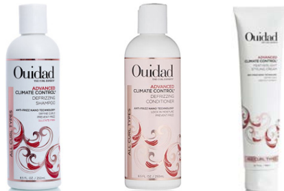
Champú 250ml/1l Acondicionador 250ml/1l Crema de peinado 168ml Gel 250ml/1l