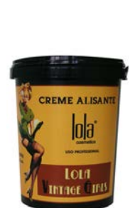
Mascarilla suavizante alisante 100g/850g