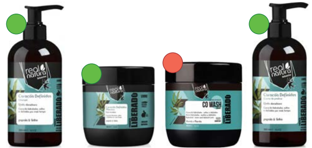
Champú 500ml Mascarilla 500ml Acondicionador co wash 500ml Crema de peinar 500ml