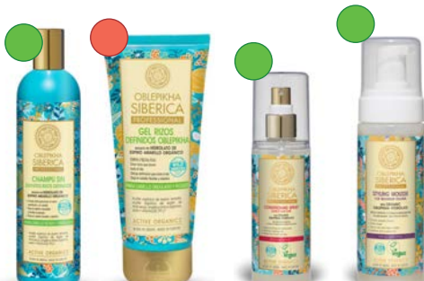
Champú 400ml Gel 200ml Leave-in 125ml Mousse 200ml