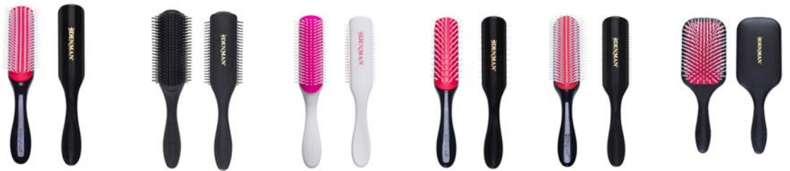
Cepillo denman D3 original Cepillo denman D3M 7 row Cepillo denman D3 Kyoto Cepillo denman D31 Cepillo denman D4 9 row Cepillo denman paddle D38 negro