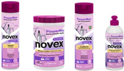
Champú 300ml Mascara 1kg Acondicionador 300ml Leave-in 300g