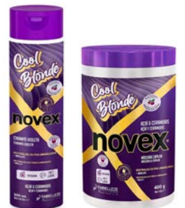
Champú 300ml Mascara 400g/1kg