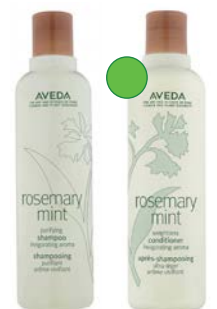
Champú 250ml/1L Acondicionador 250ml/1L