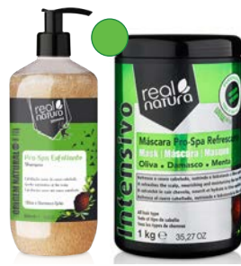
Champú 500ml Mascarilla 1kg