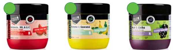
Mascarilla sandía hidratante 500ml Mascarilla plátano y guarana reconstrucción 500ml Mascarilla açai nutrición 500ml