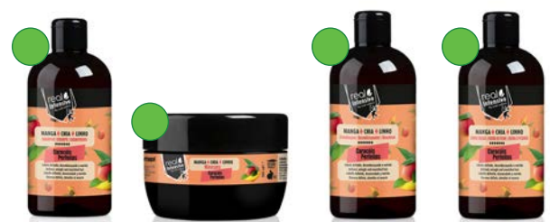
Champú 300ml Mascarilla 350ml Acondicionador 300ml Crema de peinar 300ml