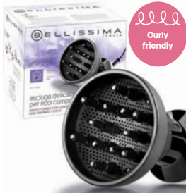
Difon DF1 1000