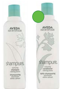
Champú 250ml/1L Acondicionador 250ml/1L