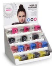
Coletero invisible (disponible en múltiples colores)