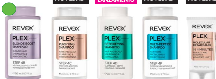
Champú matizador 260ml Champú purificante 260ml Champú detox 260ml Champú multi proteínas 260ml Mascarilla 50ml