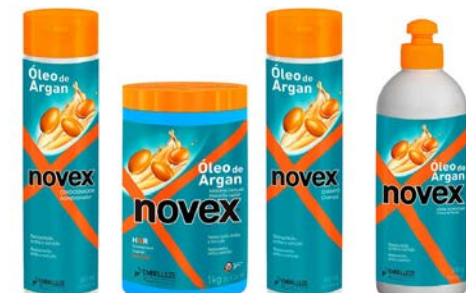
Champú 300ml Mascara 400g/1kg Acondicionador 300ml Leave-in 300g