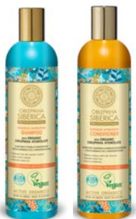
Champú 400ml Acondicionador 400ml