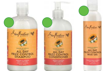
Champú 384ml Acondicionador 384ml Gel 237ml