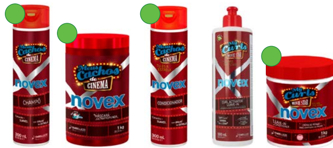
Champú 300ml Mascarilla 400g/1kg Acondicionador 300ml Leave-in 500ml Leave-in Acondicionador 1kg