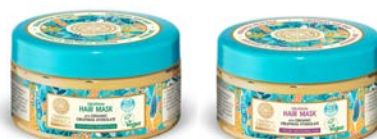
Mascarilla 300ml Mascarilla 300ml