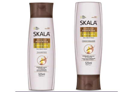
Champú 325ml Acondicionador 325ml