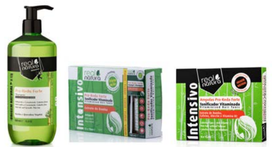
Champú 500ml KIT Ampollas + Champú Pro-Keda Ampollas anticáida 30X15ml, 6X15ml.