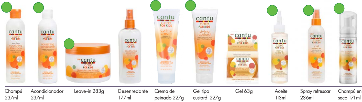
Champú 237ml Acondicionador 237ml Leave-in 283g Desenredante 177ml Crema de peinado 227g Gel tipo custard 227g Gel 63g Aceite 113ml Spray refrescar 236ml Champú en seco 171ml