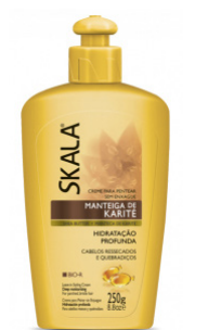
Crema de peinado 250g