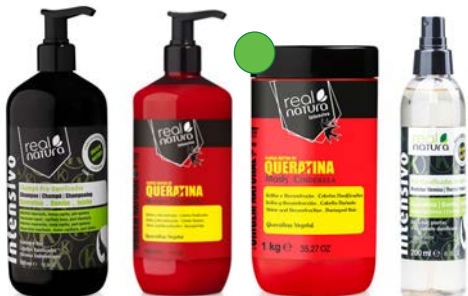
Champú 500ml Champú carga rápida queratina 500ml Mascarilla carga rápida queratina 1kg Carga líquida queratina 200ml