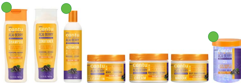
Champú 400ml Acondicionador 400ml Activador de rizos 355ml Leave-in 340g Crema de peinado 340g Mascarilla 340g Gel definidor