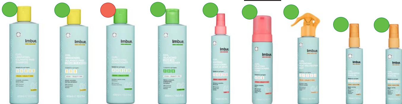
Liberating champú 400ml