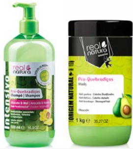
Champú 500ml Mascarilla 1kg