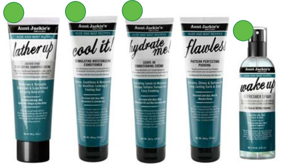
Champú clarificante 284g Acondicionador 284g Leave-in 284g Crema de peinado 284g Niebla vigorizante 118ml