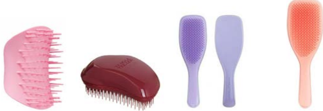
Cepillo Scalp (4 colores disponibles) Cepillo thick and curly Cepillo Wet Detangler Naturally Curly Cepillo Wet Detangler large