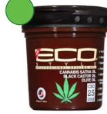
Gel 236ml/ 946ML