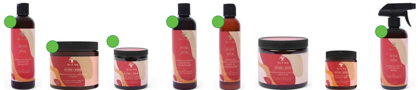
Champú 355ml Co-wash 454g Mascarilla 227g Acondicionador 355ml Leave-in 237ml Smoothie 454g Curling creme 227g Spray 473ml