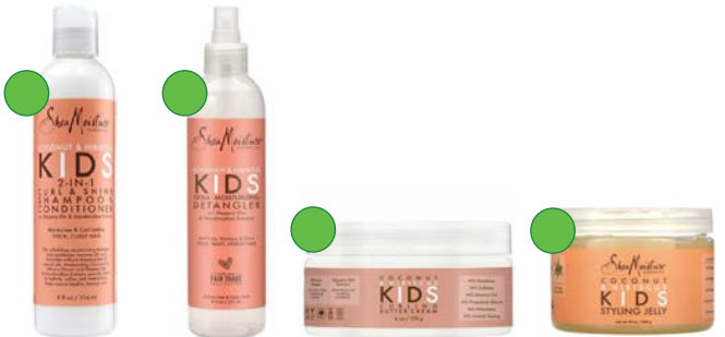
Champú y acondicionador 2en1 236ml Desenredante 237ml Crema de peinado 170g Jalea 340g