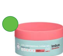
Crema gel 200ml