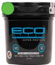
Gel 235ml/ 473ml