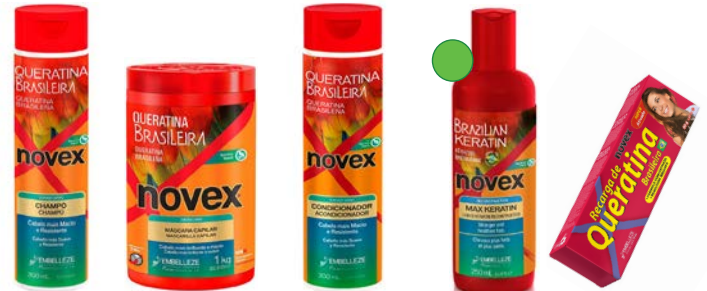
Champú 300ml Mascara 100g/400g/1kg Acondicionador 300ml Tratamiento de proteínas 250g Recarga 80g