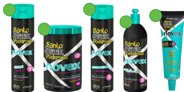
Champú 300ml Mascarilla 1kg Acondicionador 300ml Leave-in 500ml Recarga 80g