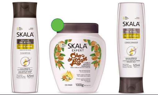
Champú 325ml Mascarilla 1kg Acondicionador 325ml