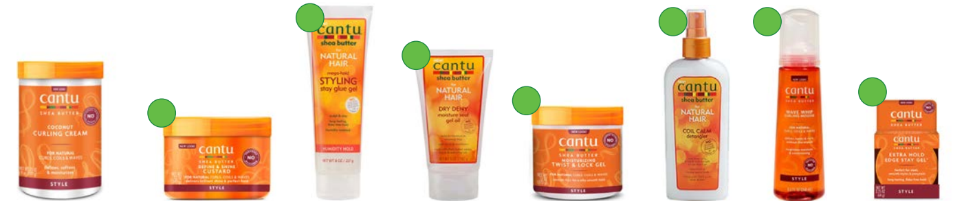
Coconut curling cream 340g/709g