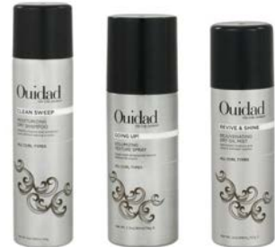
Champú en seco 160ml Spray texturizante 90ml/234ml Aceite en bruma 68ml/169ml