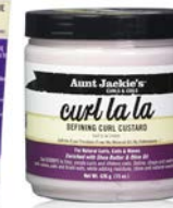
Gel custard 426g