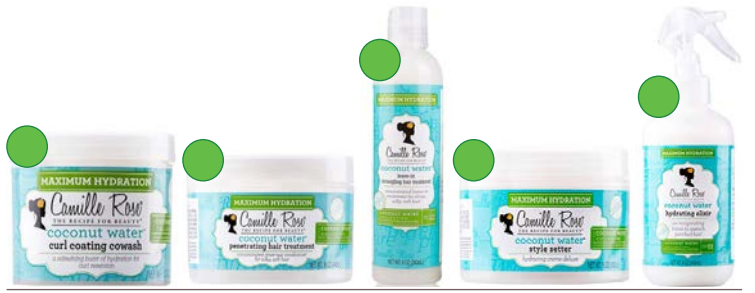
Co-wash 354ml Mascarilla 240ml Leave-in 240ml Crema de peinado 240ml Leave-in 240ml