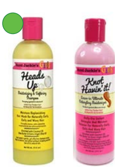
Champú clarificante 355ml Leave-in 355ml