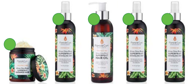
Mascarilla 300ml Mist 250ml Aceite 200ml Mist 250ml Mist 250ml