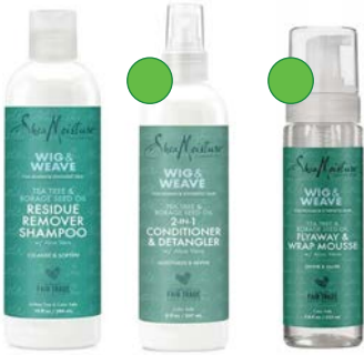
Champú 384ml Acondicionador 237ml Mousse 222ml