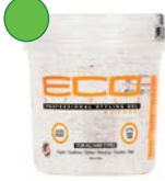
Gel 235ml/ 473ml/ 946ml