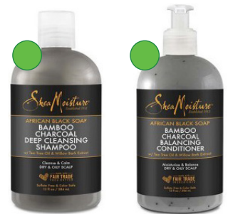
Champú 384ml Acondicionador 384ml