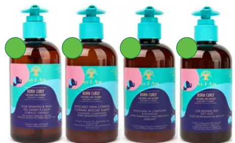
Champú 240ml Co-wash 240ml Leave-in 240ml Gel/Jelly 240ml