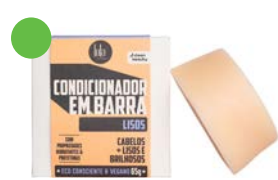
Acondicionador en barra 50g