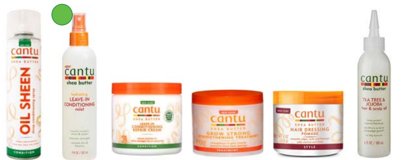
Mascarilla en spray 382ml Leave-in 237ml Leave-in 453g Tratamiento protector térmico 173g Pomada finalizadora 113g Aceite 180ml