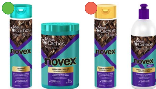
Champú 300ml Mascara 1kg Acondicionador 300ml Leave-in 500g