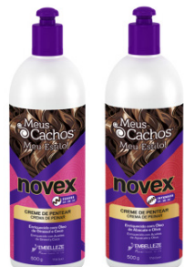
Crema de peinado suave 500g Crema de peinado fuerte 500g