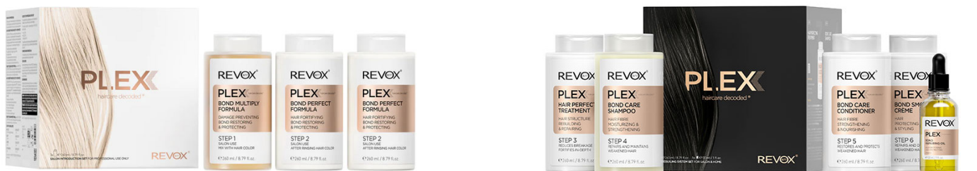
Professional set: 3X 260ML (STEP 1 X 1PCS- STEP 2 X 2PCS)