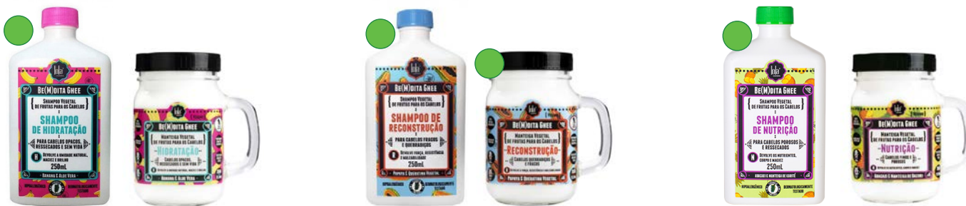
Champú hidratação 250ml Máscara hidratação 350g Champú reconstrução 250ml Máscara reconstrução 350g Champú nutrição 250ml Máscara nutrição 350g