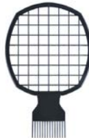
Peine rizos cabello afro twist racket