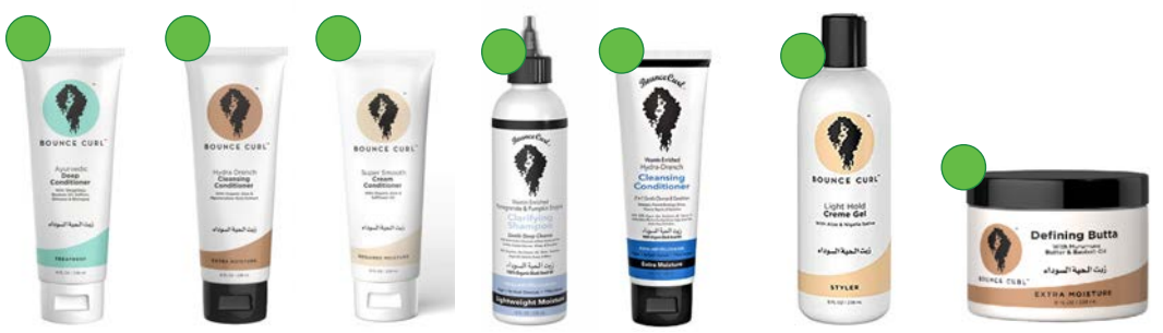
Deep conditioner 238ml Cleansing conditioner 238ml Cream conditioner 238ml Champú 236ml Cleansing conditioner 236ml Crema Gel 238ml/358ml Mantequilla de peinado 117ml