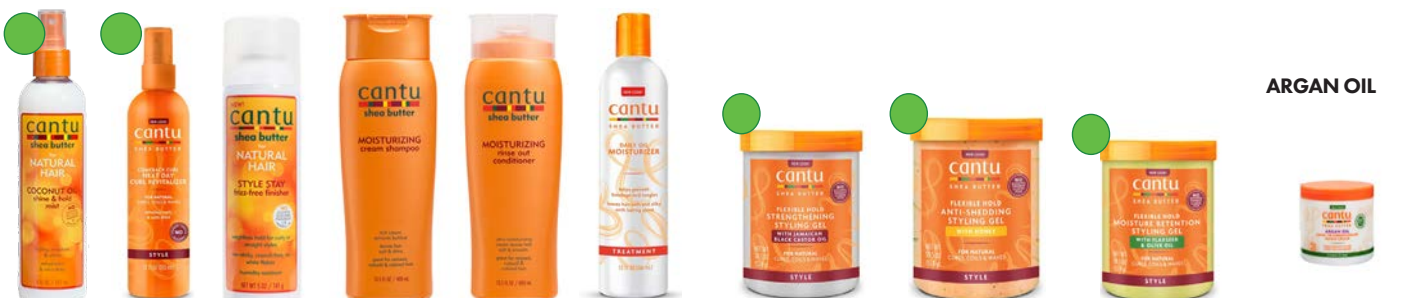
Shine and hold mist 237ml