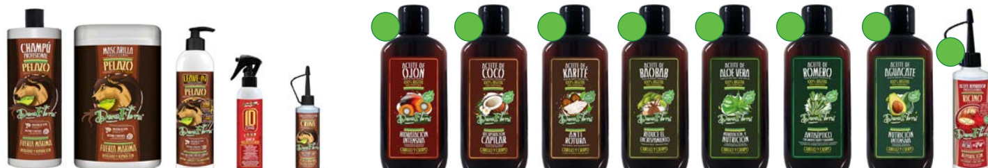
Champú 1000ml Mascarilla 1000ml Leave-in 500ml Leave-in 250ml Tónico 70ml Aceite de Ojón 100ml Aceite de Coco 100ml Aceite de Karité 100ml Aceite de Baobab 100ml Aceite de Aloe Vera 100ml Aceite de Romero 100ml Aceite de Aguacate 100ml Aceite de Ricino 70ml