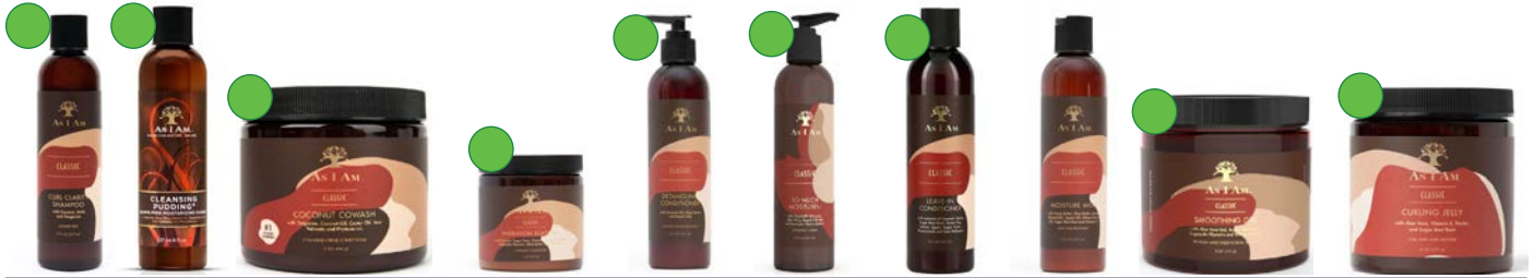
Champú 237ml Pudding limpiador 237g Co-wash 454g/227g Mascarilla 227g Detangling-conditioner 237ml So much moisture! 237ml Leave-in conditioner 237ml Leche hidratante 237ml Gel peinados 227g Gelatina 227g/454g