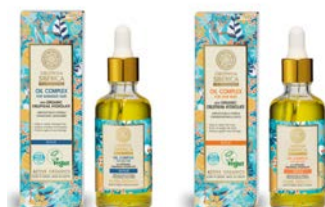
Aceite 50ml Aceite 50ml