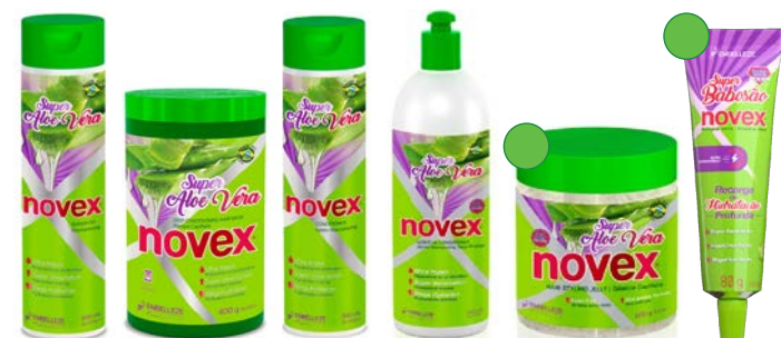
Champú 300ml Mascarilla 400g/1kg Acondicionador 300ml Leave-in 500g Gel 500g Recarga 80g