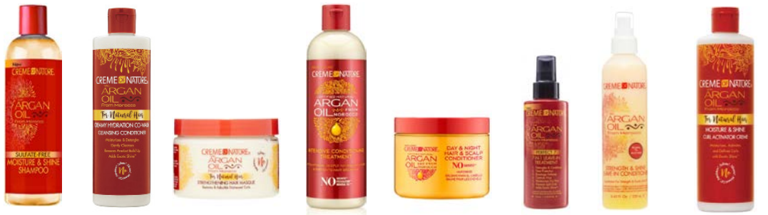
Champú 354ml Cowash 354ml Mascarilla 326g Acondicionador 354ml Crema sin aclarado 135g Leave-in 7en1 125ml Leave-in 250ml Activador de rizos 354ml