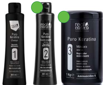
Champú 300ml Acondicionador 300ml Mascarilla 1kg