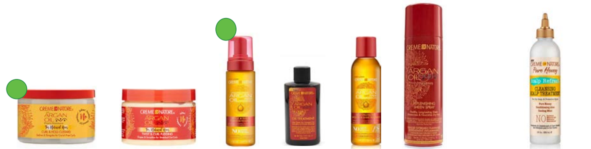
Custard 326g Crema de peinado 326g Espuma 207ml Aceite de argán 88.7ml Serúm 118ml Spray 473, 1ml Tratamiento sin aclarado 236,5ml