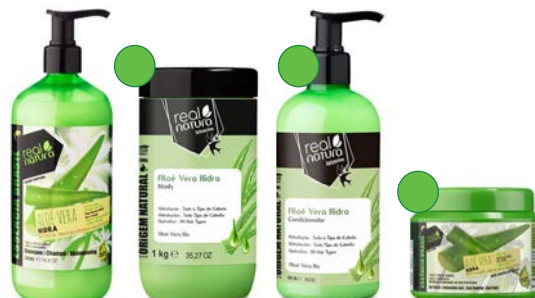
Champú 500ml Mascarilla 1kg Acondicionador 300ml Gelatina 200ml/1000ml