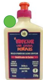
Humidificador de rizados 250g