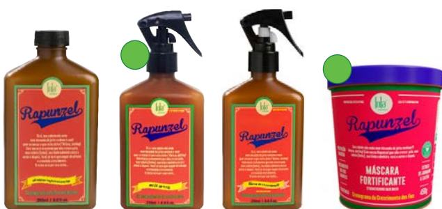
Champú 250ml Milk spray 250ml Tónico de crecimiento 250ml Mascarilla 450g