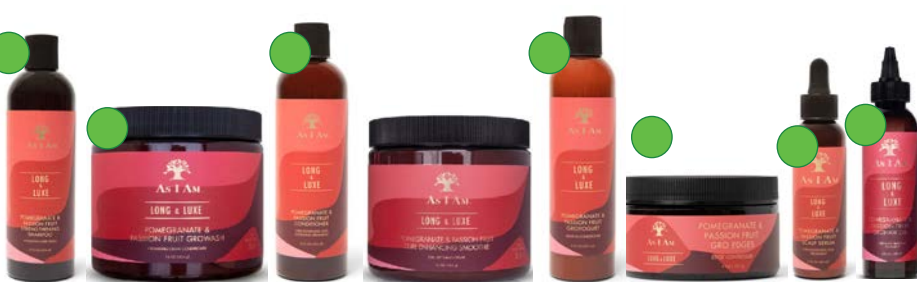
Champú 355ml Co-wash 454g Acondicionador 355ml Smoothie 454g Leave-in 237ml Gel puntas y peinados 113g Serum 60ml Aceite 120ml