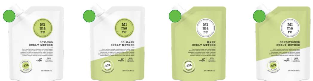
Champú 200ml/480ml Co-wash 200ml/480ml Mascarilla 200ml/480ml Acondicionador 200ml/480ml