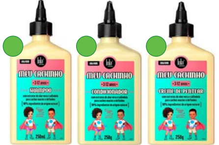
Champú 250ml Acondicionador 250g Crema de peinado 250g