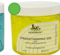
Gel con aceite de oliva virgen extra 455g