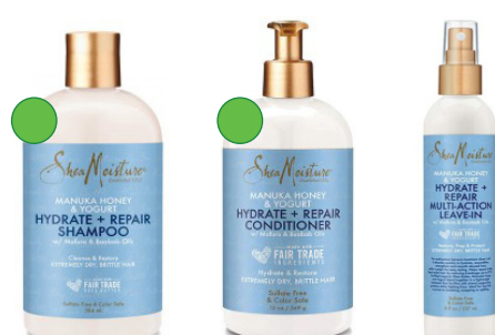
Champú 384ml Acondicionador 384ml/577ml Leave-in 237ml