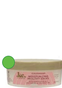
Edge gel 65g