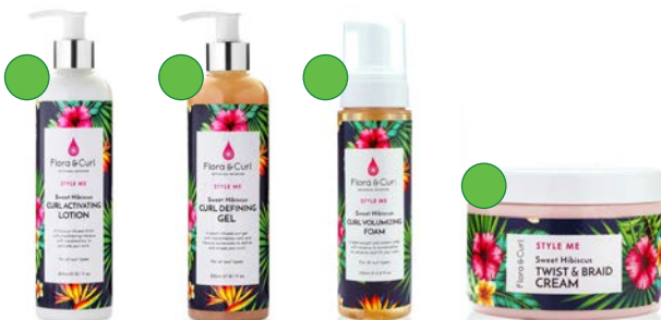
Activador de rizos 300ml/1l Gel 300ml/1l Mousse 200ml Crema de peinado 300ml