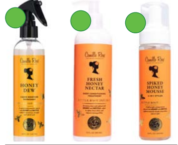
Nutriente concentrado 240ml Baño capilar 355ml Mousse 240ml