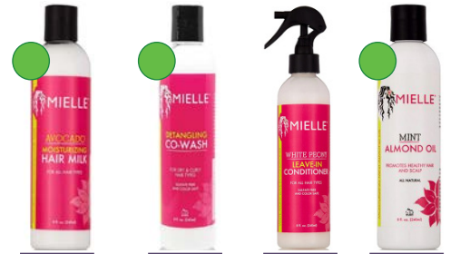
Leche de peinado 240ml Co-wash 240ml Leave-in 240ml Aceite de almendras 240ml