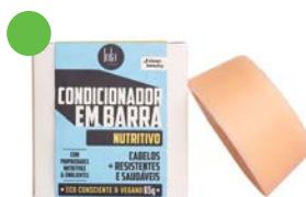
Acondicionador en barra 50g