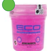
Gel 235ml/ 473ml/ 946ml