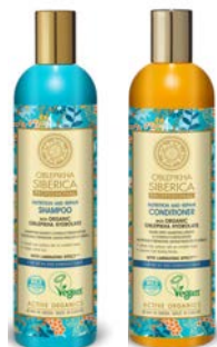
Champú 400ml Acondicionador 400ml