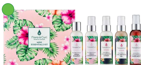
Low-poo, acondicionador, activador, gel y bruma 75ml