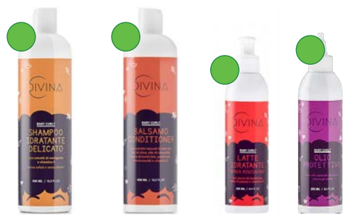
Champú 500ml Acondicionador 500ml Leave-in 250ml Aceite 250ml