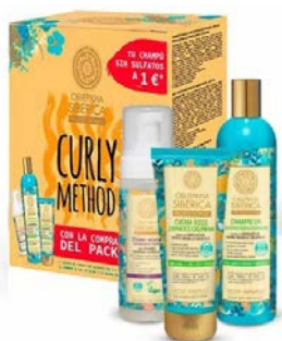
Curly Method pack Champú 400ml + Gel 200ml + Mousse 170ml