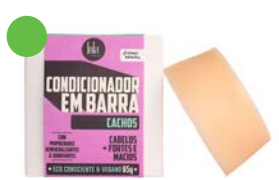
Acondicionador en barra 50g