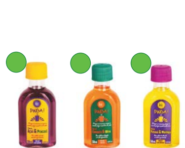
Açaí & praxai 50ml Cenoura & oliva 50ml Pataú & moringa 50ml