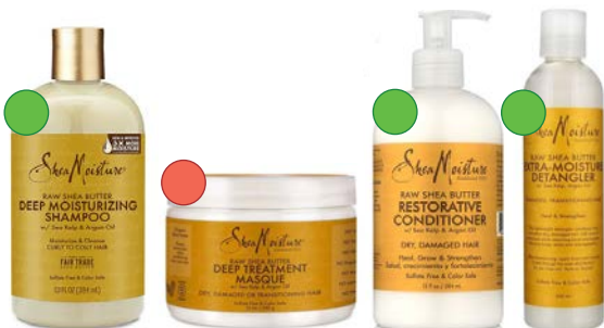
Champú 384ml Mascarilla 340g Acondicionador 384ml Desenredante 237ml