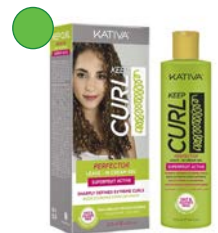
KEEP CURL PERFECTOR Leave-in crema gel 200ml