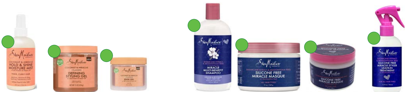
Bruma 236ml Gel definición 426g Gel para bordes 99g Champú 384ml Mascarilla 384ml Tratamiento 340g Leave-in 101ml/237ml