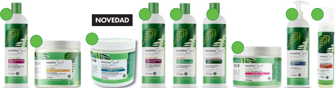
Champú 473ml Co-wash 454g Mascarilla hidratante 454g Acondicionador 475ml Leave-in 475g Activador de rizos 475g Crema de peinado 360g Gel 355g Mousse volumen 237ml