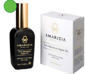
Aceite de argán 10ml / 96ml