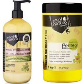
Modelador 500ml Crema de peinar 1kg