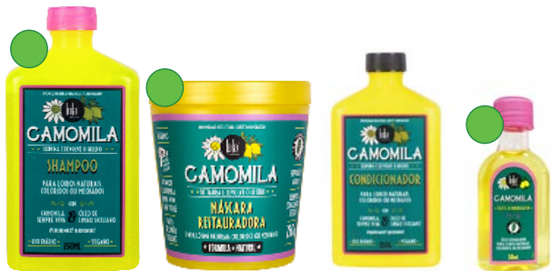
Champú 250ml Mascarilla 230g Acondicionador 250g Aceite 50ml