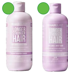
SHAMPOO & CONDITIONER FOR CURLY, WAVY HAIR 350ml