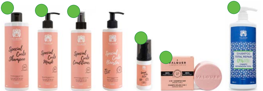
Champú 400ml/1L Mascarilla 290ml/ 1L Leave-in 300ml Booster 290ml Serum Champú y acondicionador 70g