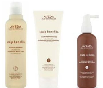
Champú 250ml Acondicionador 200ml Tratamiento cuero cabelludo 150ml