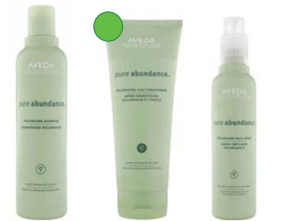
Champú 250ml/1L Acondicionador 200ml Spray voluminizador 200ml