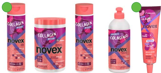
Champú 300ml Mascarilla 400g/1kg Acondicionador 300ml Leave-in 300ml Recarga 80g