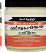
Crema de peinado 426g