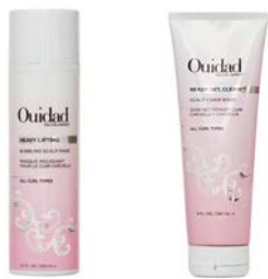
Mascarilla cuero cabelludo 200ml