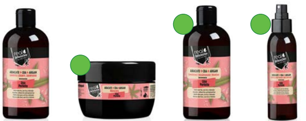
Champú 300ml Mascarilla 350ml Acondicionador 300ml Aceite 100ml