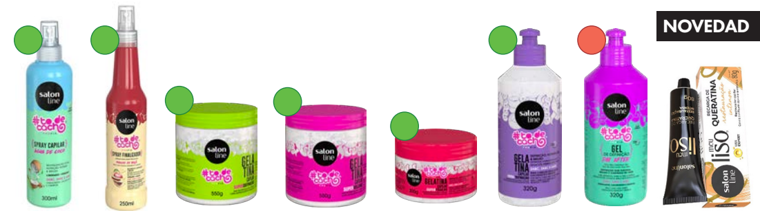
Spray coco 300ml Spray vinagre de manzana 250ml Gel 550g/1000g Gel 550g Gel 350g Gel 320g Gel 320g Recarga queratina 80g