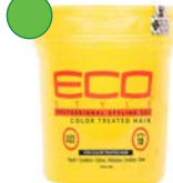
Gel 235ml/ 473ml/ 946ml