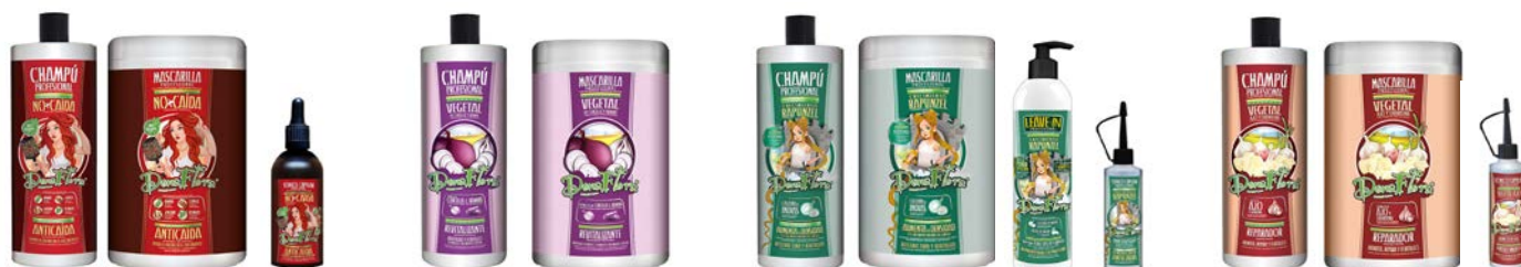
Champú 1000ml Mascarilla 1000ml Tónico 100ml Champú 1000ml Mascarilla 1000ml Champú 1000ml Mascarilla 1000ml Leave-in 500ml Tónico 70ml Champú 1000ml Mascarilla 1000ml Tónico 70ml