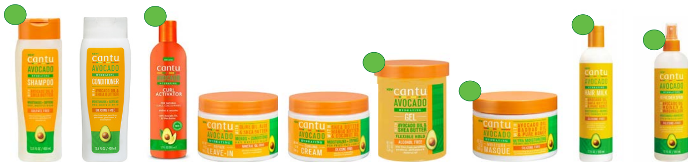
Champú 400ml Acondicionador 400ml Activador de rizos 355ml Leave-in 340g Crema de peinado 340g Gel definidor 524g Mascarilla 340g Loción hidratante 355ml Spray 355ml