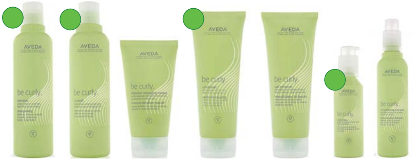
Champú 250ml/1L Co-wash 250ml Mascarilla 150ml Acondicionador 200ml/1L Crema de peinado 200ml Leave-in 100ml Spray fijador 200ml