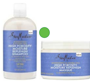
Champú 384ml Mascarilla 312g