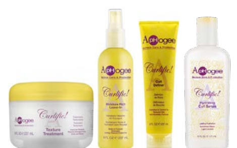
Tratamiento 237ml Leave-in 237ml Definidor de rizos 237ml Serúm 177ml