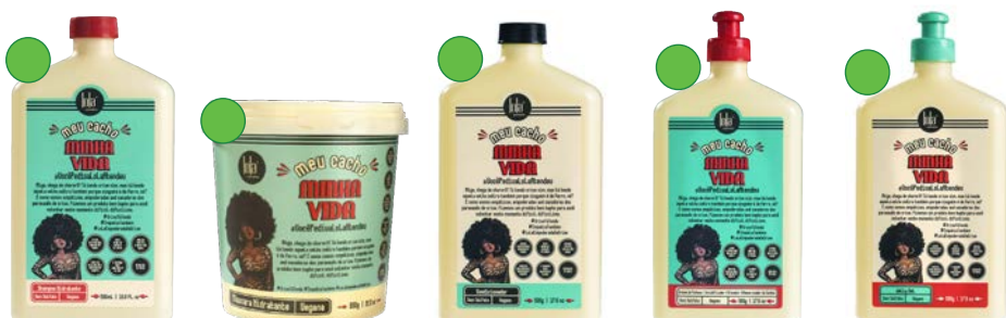
Champú 500ml Máscara 450g Acondicionador 500g Crema de peinar 500g Gel de peinado 500g