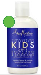
Champú y acondicionador 2en1 236ml