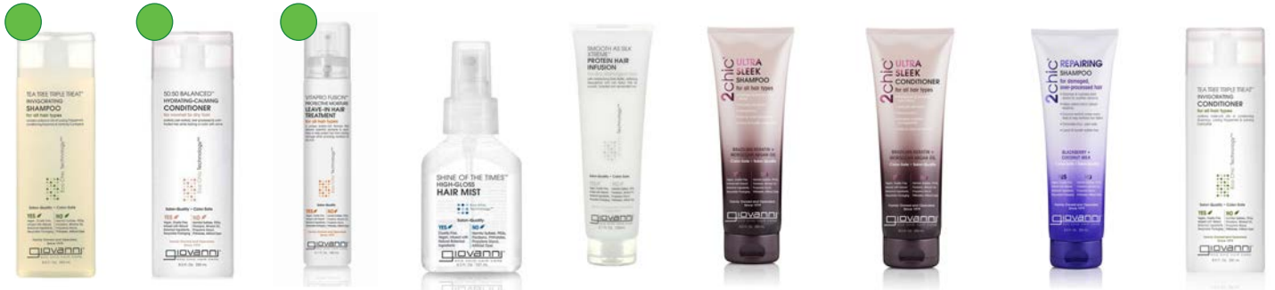
Champú 250ml Balanced conditioner 250ml Leave-in 150ml Hair mist 127ml Smooth protein 150ml Sleek champú 250ml Sleek acondicionador 250ml Repairing champú 250ml Acondicionador 250ml

Establecidos en Verona, Italia, e inspirados por las características de la propia ciudad, surgió en 2017 DIVINA BLK.