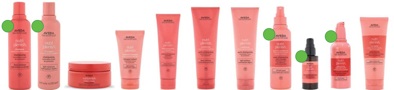
Champú deep 250ml/1L Champú light 250ml/1L Mascarilla 200ml Mascarilla light 150ml Tratamiento 150ml Acondicionador deep 250ml/1L Acondicionador light 250ml/1L Leave-in spray 200ml Aceite 30ml Serúm 100ml Gel 200ml