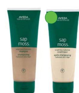
Champú 200ml/400ml Acondicionador 200ml