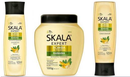
Champú 325ml Mascarilla 1kg Acondicionador 325ml