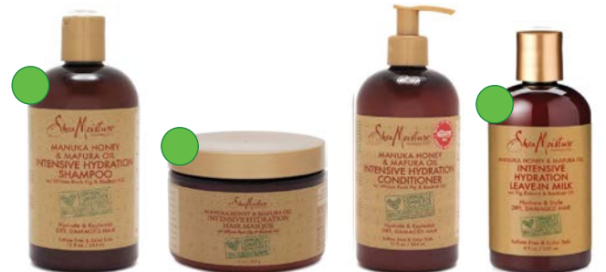
Champú 384ml Mascara 284g/340g Acondicionador 384ml/ 710ml Leave-in 237ml