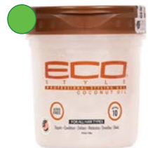
Gel 235ml/ 473ml/ 946ml