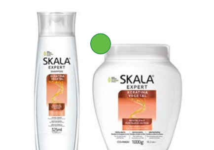
Champú 325ml Mascarilla 1kg