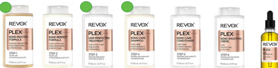
Tratamiento 260ml Tratamiento 260ml Tratamiento 260ml Champú 260ml Acondicionador 260ml Crema alisadora 260ml Aceite 30ml