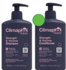
Champú 400ml Acondicionador 400ml