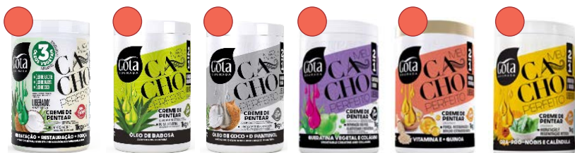
Mascarilla/crema de peinado 1kg Mascarilla/crema de peinado 1kg Mascarilla/crema de peinado 1kg Mascarilla/crema de peinado 1kg Mascarilla/crema de peinado 1kg Mascarilla/crema de peinado 1kg