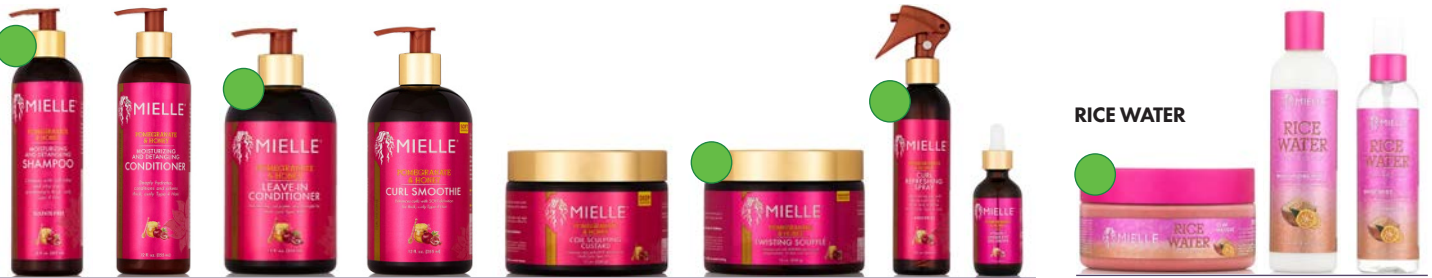
Champú 355ml Acondicionador 355ml Leave-in 355ml Smoothie 355ml Gel custard 340g Twisting soufflé 340g Spray refrescar 240ml Gotas vitamina C 59ml Mascarilla capilar y corporal 227g Leche de peinado 227g Bruma 118ml