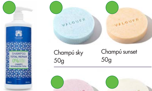
Champú 1L Champú sky 50g Champú sunset 50g