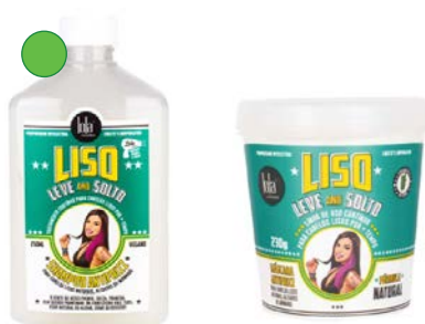
Champú 250ml Mascarilla 230ml