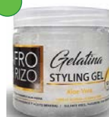
Gelatina Aloe Vera 453g