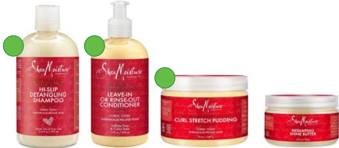
Champú 399ml Acondicionador Leave-in 384ml Pudding 340g Manteca 106g