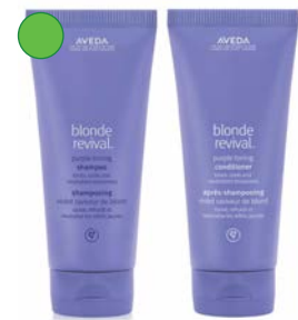
Champú 200ml/1000ml Acondicionador 200ml