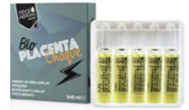
Ampollas anticáida 5X10ml