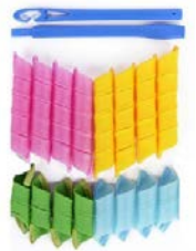
Rulos magic leverag