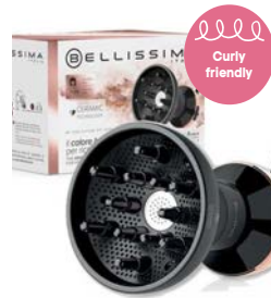
Difon DF1 3000