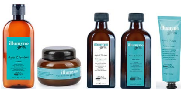
Champú 250ml/1L Mascarilla 250ml/500ml Elixir regenerador 100ml Elixir brillo 100ml Aceite en crema 50ml