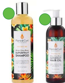
Champú 300ml/1l Aceite 200ml