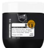
Mascarilla alisamiento 500ml