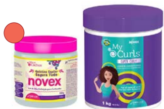
Gel gelatina segura 500g Crema de peinado/Leave-in 1kg