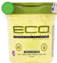
Gel 235ml/ 473ml/ 946ml