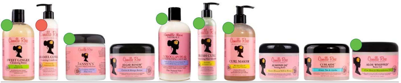
Champú 355ml Co-wash 240ml Acondicionador 240ml Mascarilla 240ml Acondicionador 355ml Crema de peinado 240ml Gel 355ml Twisting butter 240ml Crema para peinados 240ml Crema para peinados 240ml