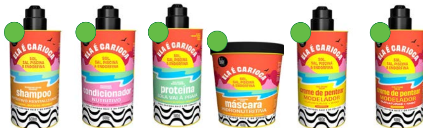
Champú 500ml Acondicionador 500ml Proteína 500gr Máscara 450g Crema de peinar 3ABC 480gr Crema de peinar 4ABC 480gr