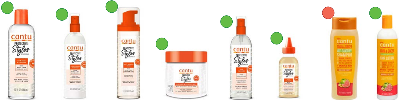
Champú 3 en 1 296ml