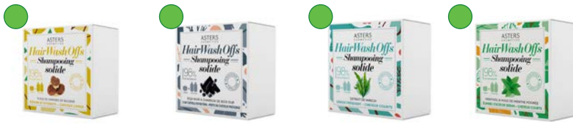
Champú sólido 250ml