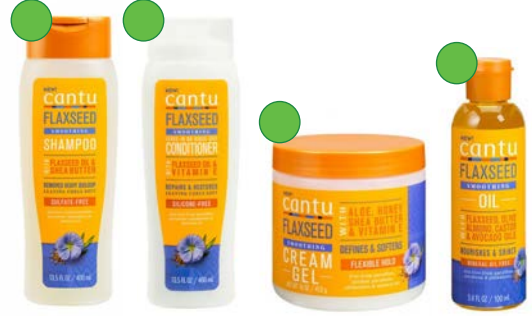
Champú 400ml Acondicionador 400ml Crema-gel de peinado 453g Aceite 100ml