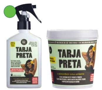
Spray 250ml Mascarilla 230g