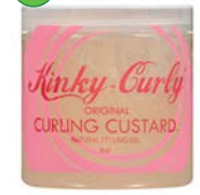
Gel custard 236ml