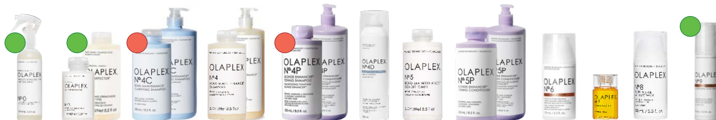
N°0 155ml N°3 100ml/250ml N°4C 1000ml/250ml N°4 1000ml/250ml N°4P 250ml/1000ml N°4D 250ml N°5 250ml N°5P 250ml/1000ml N°6 100ml N°7 30ml N°8 100ml N°9 90ml