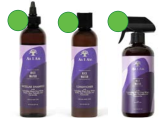
Champú 237ml Acondicionador 237ml Spray 473ml