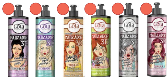
Tonos súper black, platinado, cobre, vermelo intenso, grafite, marsala y pérola.