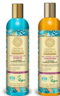
Champú 400ml Acondicionador 400ml