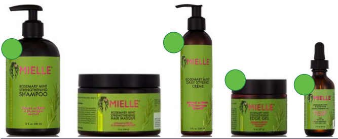
Champú 355ml Mascarilla 340g Crema de peinado 240ml Gel puntas y peinados 57g Aceite de romero 59ml