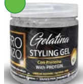
Gelatina con proteína 453g