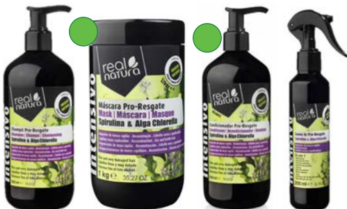
Champú 500ml Mascarilla 500ml/1kg Acondicionador 500ml Leave-in 200ml