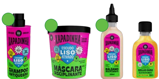
Champú 250ml Máscara 100gr/450gr Bálsamo 200ml Óleo 50ml