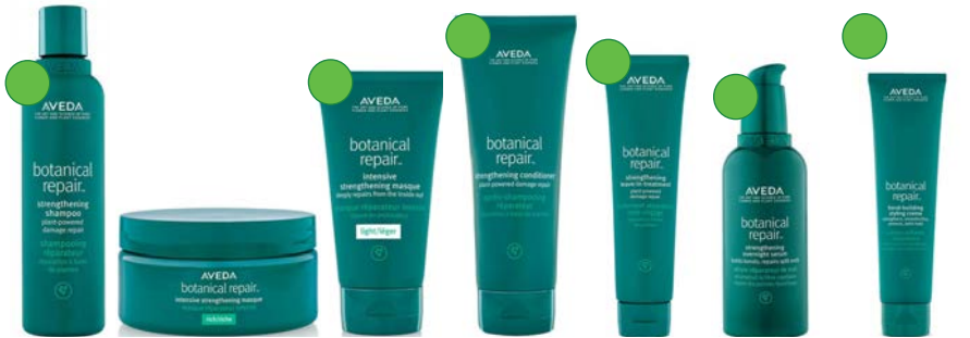
Champú 250ml/1L Mascarilla rich 200ml/450ml Mascarilla light 150ml/350ml Acondicionador 200ml/1L Crema de peinado 200ml Serum 30ml/100ml Crema de peinado 150ml