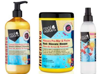
Champú 500ml Mascarilla 1kg Spray 200ml