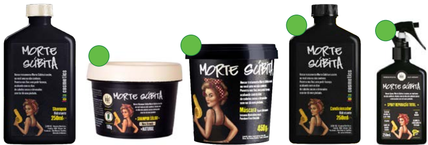
Champú 250ml Champú exfoliante 100g Mascarilla 450g Acondicionador 250 ml Spray reparación 250 ml