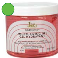
Gel con aceite de ricino negro 455g