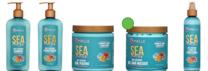
Champú 236,6ml Acondicionador 236,6ml Crema de peinado 277g Mascarilla 235ml Leave-in 236,6ml