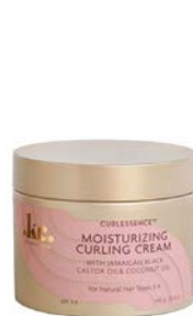
Crema de peinado 340g