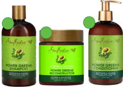
Champú 384ml Mascarilla 227g Acondicionador 384ml