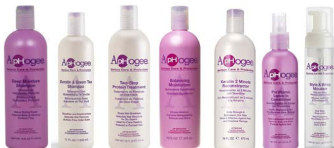
Champú 473ml Champú 355ml Tratamiento 118ml/473ml Acondicionador 473ml Tratamiento 237/473ml Leave-in 237ml Mousse 251ml