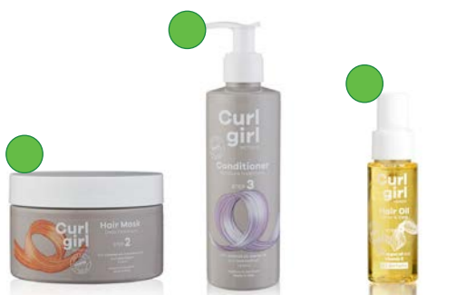
Mascarilla 200ml Acondicionador 200ml Aceite 50ml