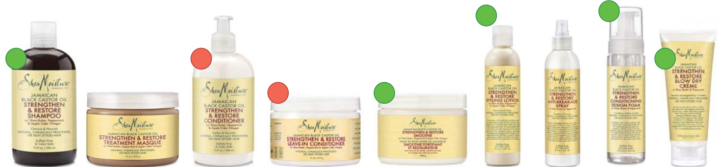
Champú 384ml Mascara 340g Acondicionador 384ml Leave-in 312g/454g Smoothie 340g Styling lotion 237ml Spray antirrotura 237ml Mousse 222ml Crema de peinado 177ml