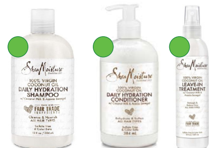
Champú 384ml /577ml Acondicionador 384ml/577ml Leave-in 237ml