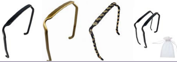
Diadema diferentes colores Original fit Slim relaxed fit Diadema diferentes colores Original fit Slim relaxed fit Diadema forrada diferentes colores Original fit Slim relaxed fit Pack diademas negra slim y normal