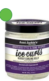
Jelly gel 426g