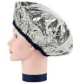
Gorro tratamiento aluminio color plata / dorado