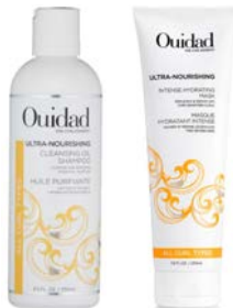
Champú 250ml Mascarilla 230ml