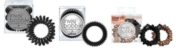
Coletero invisible Coletero invisible slim (disponible en múltiples colores) Coletero sprunchie slim (disponible en múltiples colores)