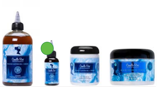
Champú 355ml Aceite 59ml Manteca 240ml Acondicionador 240ml