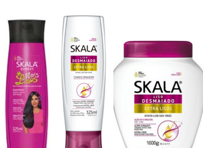
Champú 325ml Acondicionador 325ml Mascarilla 1kg