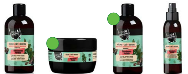
Champú 300ml Mascarilla 350ml Acondicionador 300ml Tónico 100ml