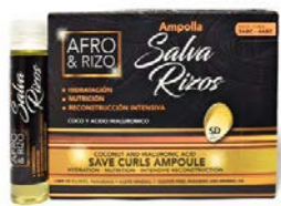
Ampolla 30ml x 1 unidad