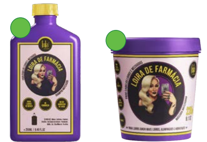
Champú 250ml Mascarilla 230g