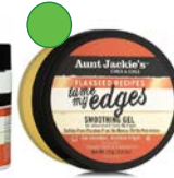
Gel puntas y peinados 71g