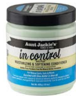
Acondicionador Co-wash / mascarilla 426g