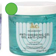
Gel con biotina 455g