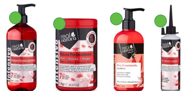
Champú 500ml Mascarilla 1kg Acondicionador 300ml Aceite 70ml