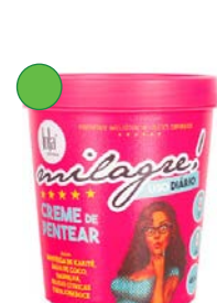
Crema de peinado 450g