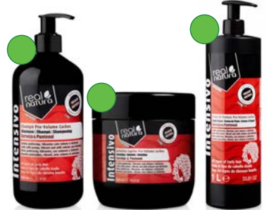
Champú 500ml Gelatina 500ml Crema de peinar 1L