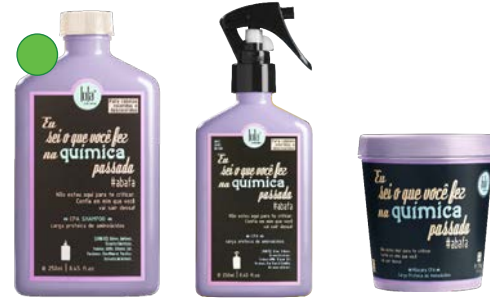
Champú 250ml Spray carga proteica de aminoácidos 250ml Mascarilla 230g