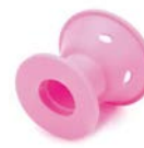
Rulos silicona roll cap