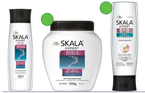
Champú 325ml Mascarilla 1kg Acondicionador 325ml