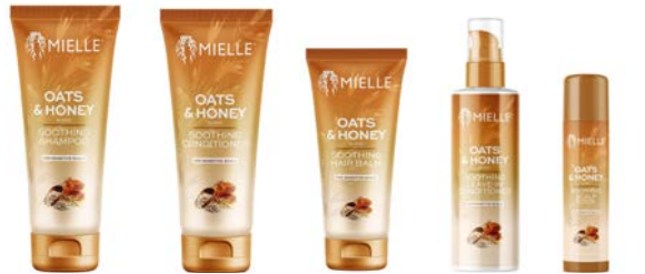
Champú- 237ml Acondicionador 237ml Balsamo 177ml Leave-in 177ml Stick 14g