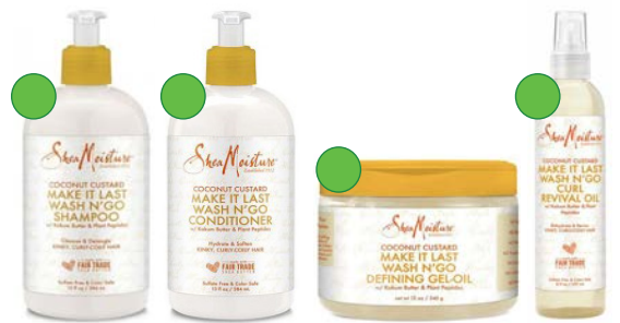
Champú 384ml Acondicionador 384ml Gel-oil wash n' go 340g Aceite 237ml