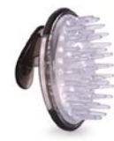
Cepillo para masajes spa brush