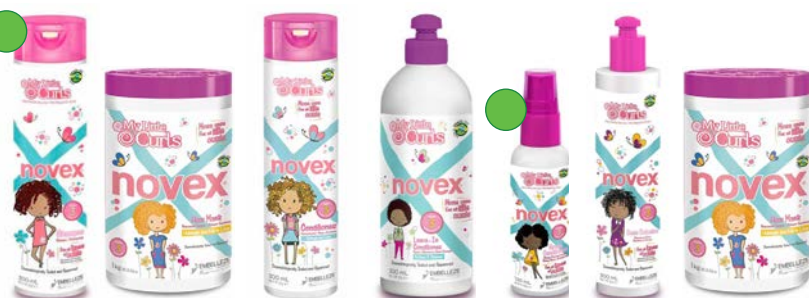
Champú 300ml Mascara 400g/1kg Acondicionador 300ml Leave-in 300ml Spray desdrenante 120ml Activador 300ml Gelatina capilar 500g