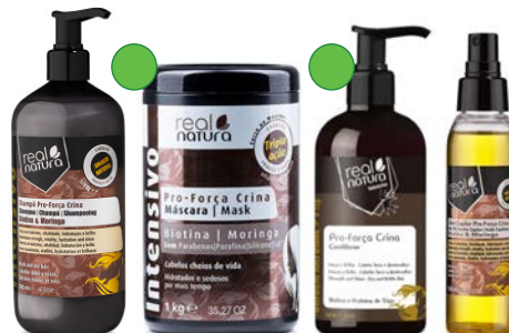
Champú 500ml Mascarilla 1kg Acondicionador 500ml Aceite 100ml