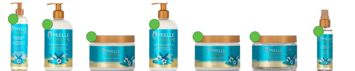
Champú 355ml Acondicionador 355ml Mascarilla intensiva nocturna 340g Leave-in 355ml Crema de peinado 340g Gel 340g Tratamiento cuero cabelludo 59ml