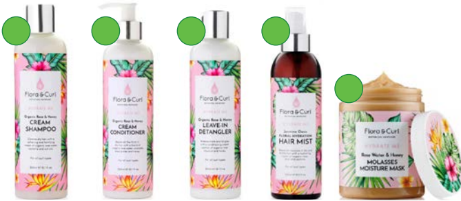
Champú low-poo 300ml Acondicionador 300ml Leave-in 300ml Bruma capilar 250ml Mascarilla 300ml