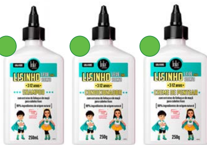
Champú 250ml Acondicionador 250g Crema de peinado 250g