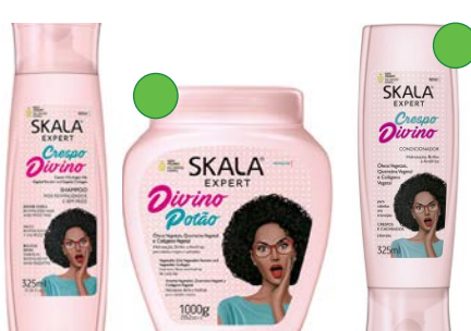
Champú 325ml Mascarilla/crema de peinado 1kg Acondicionador 325ml