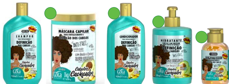
Champú 430ml Mascarilla 1kg Acondicionador 430ml Crema de peinado 320g Óleo finalizador 60g