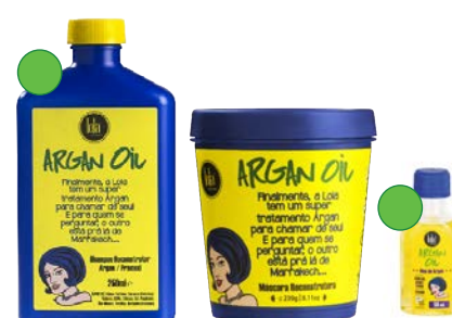
Champú 250ml Máscara 230g Aceite de argán 50ml