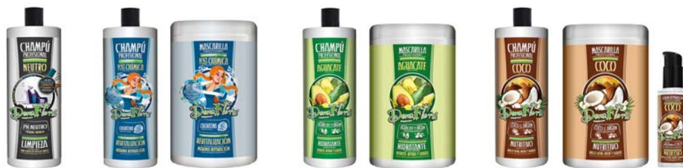
Champú 1000ml Champú 1000ml Mascarilla 1000ml Champú 1000ml Mascarilla 1000ml Champú 1000ml Mascarilla 1000ml Serúm 100ml