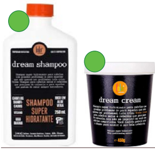
Champú 250ml Mascarilla 200g/ 450g/3Kg