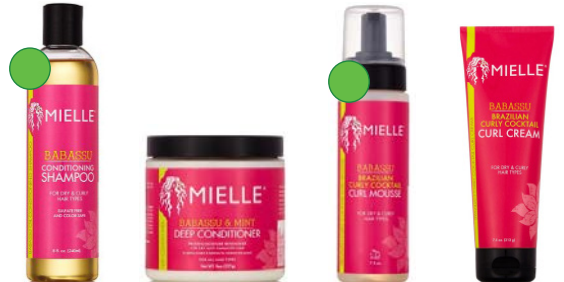
Champú 240ml Mascarilla 227g Mousse 213g Crema gel 213g