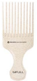
Peine ahuecador clásico comb nº10