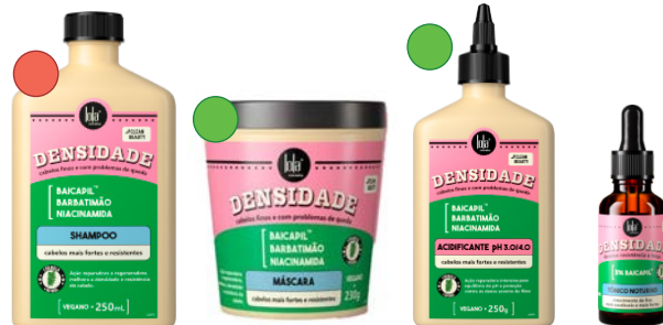
Champú 250ml Máscara 230g Acidificante 250g Tónico 25ml