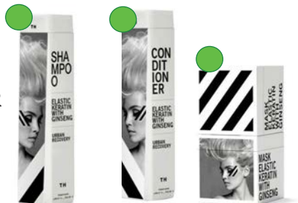
Champú, 300ml, 1000ml Acondicionador 300ml, 1000ml Mascarilla 220ml, 500ml