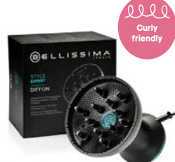
Style Expert Diffon