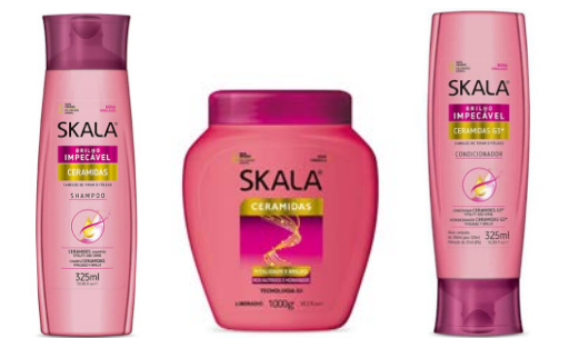
Champú 325ml Mascarilla 1kg Acondicionador 325ml