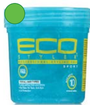
Gel 235ml/ 473ml/ 946ml