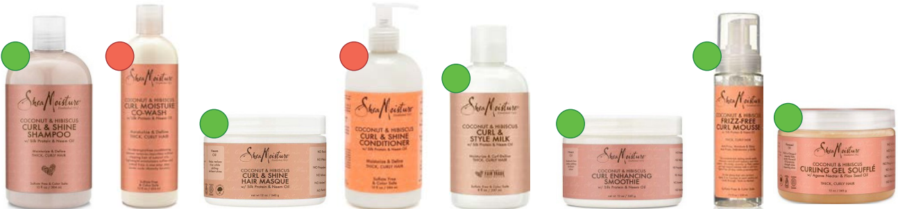
Champú 384ml Co-wash 354ml Mascarilla 340g Acondicionador 384ml Milk 237ml Smoothie 284g /326g /340g Mousse 220ml Gel soufflé 340g