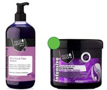
Champú 500ml Mascarilla 500ml