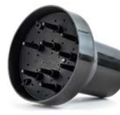
Wind difusor universal grande