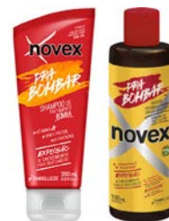
Champú 200ml Solución potenciadora 100ml