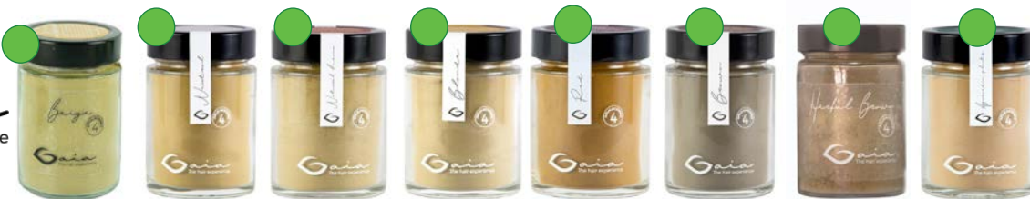
Beige 175g Neutral 175g Henna clásica natural 175g Blonde 175g Red 175g Brown 175g Herbal brown 175g Plantas ayurvédicas 175g