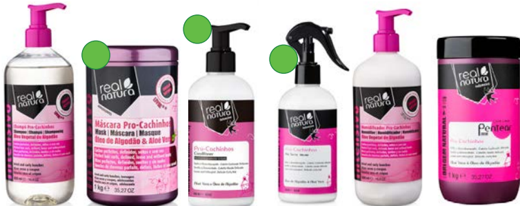
Champú 500ml Mascarilla 500g/1kg Acondicionador 300ml Bi-Fase 300ml Humidificador 500ml Crema para peinar 1000ml