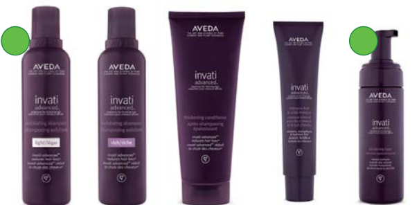
Champú light 200ml /1000ml Champú rich 200ml /1000ml Acondicionador 200ml /1000ml Mascarilla intensiva 150ml Mousse volumen 150ml