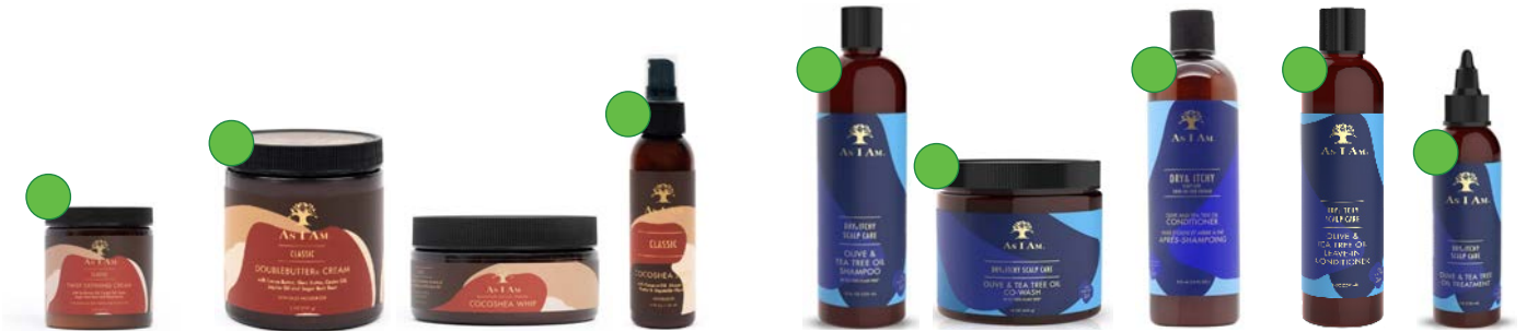
Crema de peinado para twists 227g Crema de peinado 227g/454g Crema styling para contornos y peinados 227g CocoShea spray 120ml Champú 355ml Co-wash 454g Acondicionador 355ml Leave-in 237ml Tratamiento de aceite 120ml