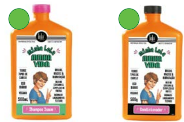
Champú 500ml Acondicionador 500g