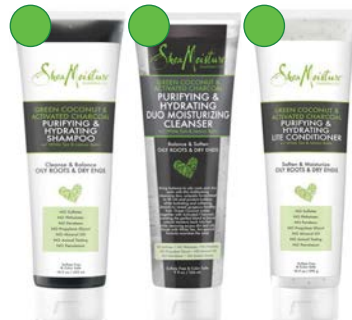
Champú 305ml Champú 266ml Acondicionador 292g