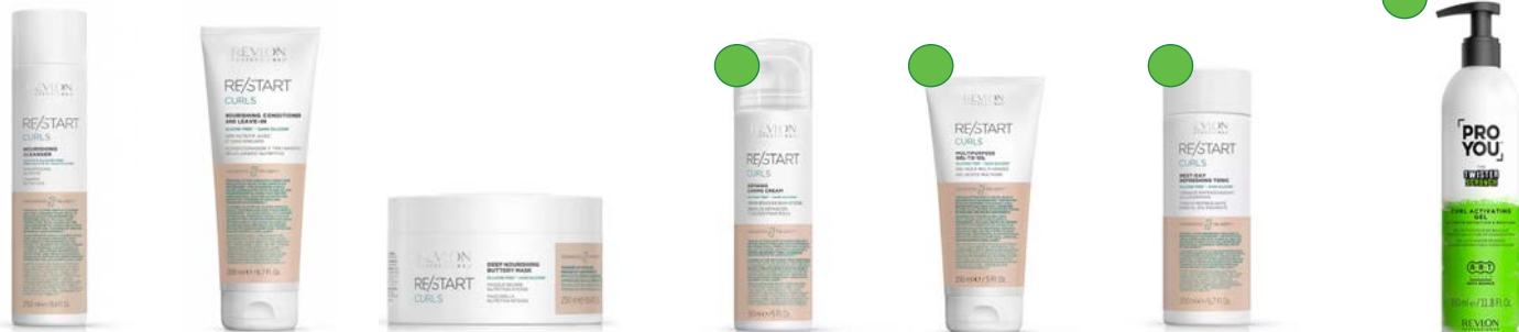
Limpiador 250ml / 1000ml