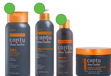
Champú 400ml Activador de rizos 295ml Aceite 100ml Leave-in 370g