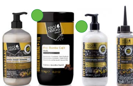
Champú 500ml Mascarilla 1kg Acondicionador 500ml Aceite 70ml