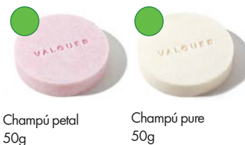
Champú petal 50g Champú pure 50g