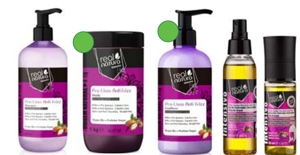
Champú 500ml Mascarilla 1kg Acondicionador 500ml/300ml Aceite 100ml Serúm 50ml