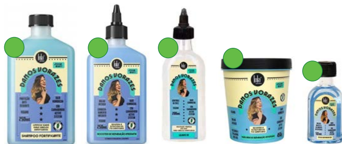
Champú 250ml Booster 250ml Leave-in 200ml Máscara 450g Aceite 50ml