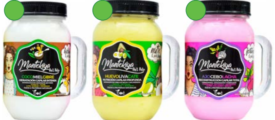
Mascarilla 454g Mascarilla 454g Mascarilla 454g