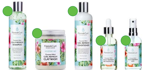
Champú low-poo 300ml Arcilla de lavado 260g Acondicionador 300ml Aceite 50ml Bruma capilar 100ml