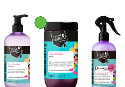
Champú 500ml Mascarilla 1kg Spray 300ml