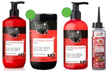
Champú 500ml Mascarilla 1kg Acondicionador 500ml/300ml Tónico 70ml