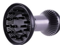
Secador difusor Rizzi Dryer