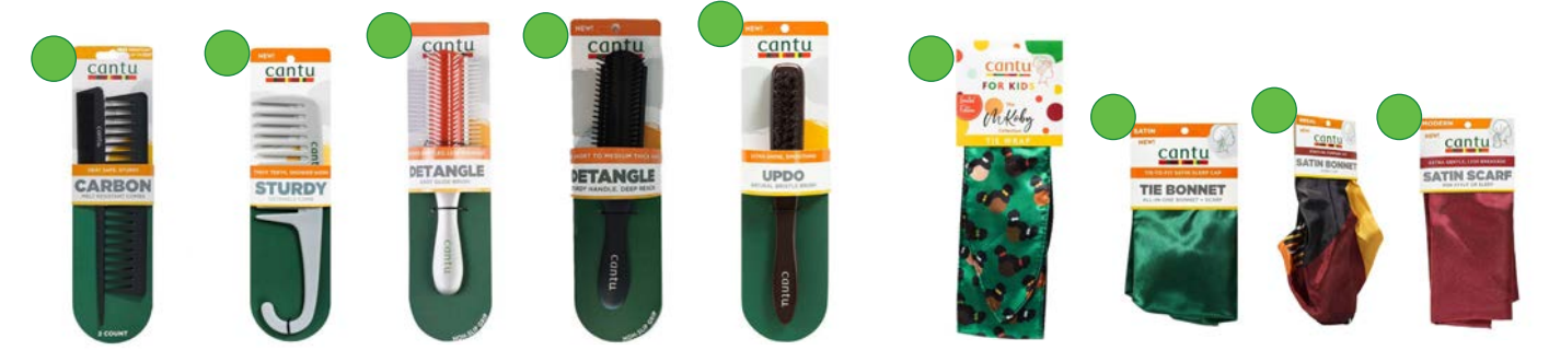
Juego de dos peines Peina shower hook detangle Cepillo ultra glide Cepillo deep reach Cepillo natural bristle Banda flexible Pañuelo satin tie bonnet Gorro satin bonnet Pañuelo satin scarf