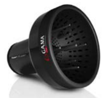
Difusor extra grande