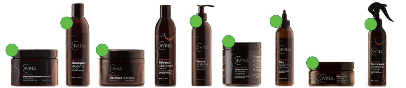
Mascarilla prepo 500ml Champú 250ml Mascarilla nutritiva 500ml Acondicionador 250ml/400ml Leave-in 150ml/250ml/1L Gel custard 250ml Aceite 200ml Manteca 300ml Spray desenredante 250ml