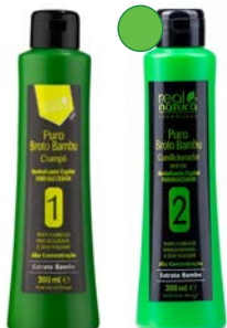
Champú 300ml Acondicionador 300ml