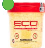
Gel 235ml/ 473ml/ 946ml