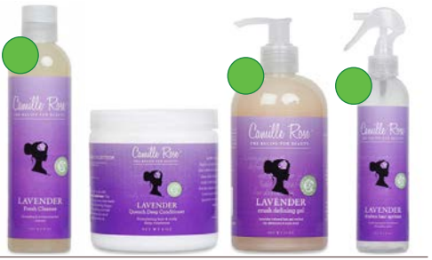
Champú 236ml Mascarilla 240ml Gel 355ml Spray desenredante 240ml