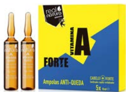
Ampollas anticaída 5X10ml