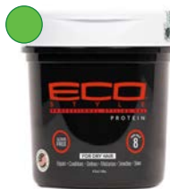
Gel 235ml/ 473ml/ 946ml