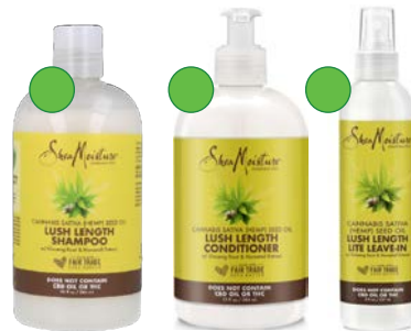
Champú 384ml Acondicionador 384ml Leave-in 237ml