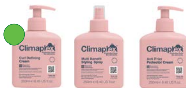
Crema definición 250ml Spray 250ml Crema anti frizz 250ml