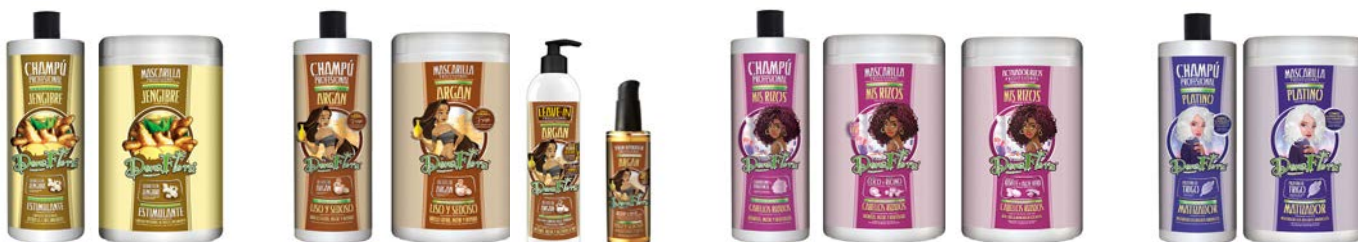
Champú 1000ml Mascarilla 1000ml Champú 1000ml Mascarilla 1000ml Leave-in 500ml Serúm 100ml Champú 1000ml Mascarilla 1000ml Activador 1000ml Champú 1000ml Mascarilla 1000ml