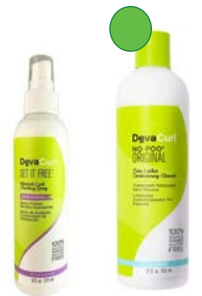
Spray 177ml No-poo 355ml