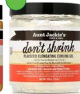
Gel elongador 426g