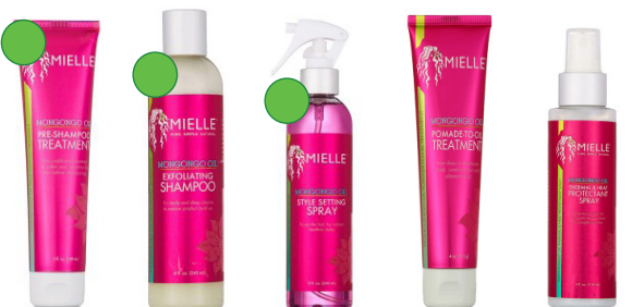
Prepoo 148ml Champú 240ml Spray fijador 240ml Pomada de aceites 148ml Spray protector 118ml