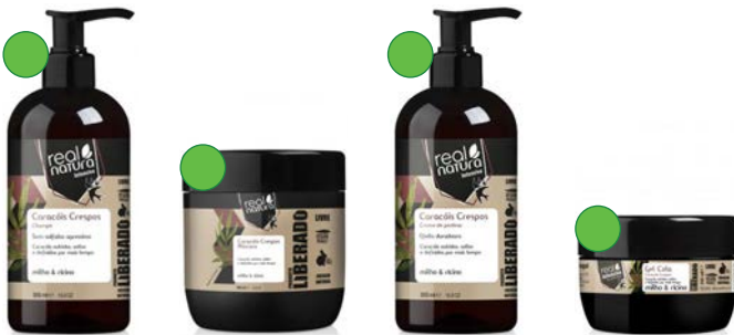
Champú 500ml Mascarilla 500ml Crema de peinar 500ml Gel 350ml