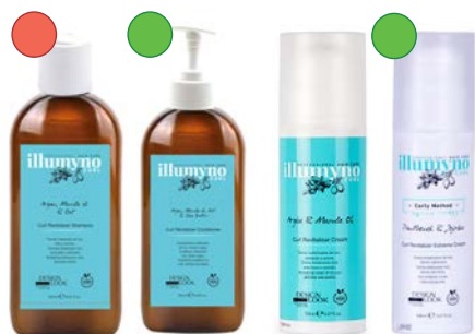
Champú 250ml Acondicionador 250ml Crema gel 150ml Crema gel fuerte 150ml