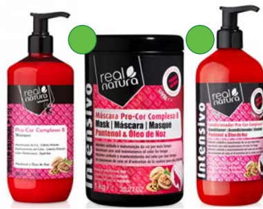
Champú 500ml Mascarilla 1kg Acondicionador 500ml