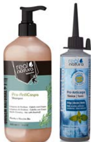
Champú 500ml Tónico 70ml