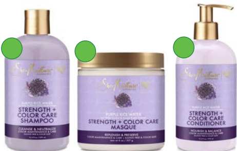
Champú 384ml Mascarilla 227g Acondicionador 370ml