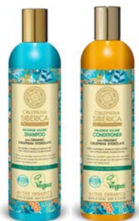
Champú 400ml Acondicionador 400ml