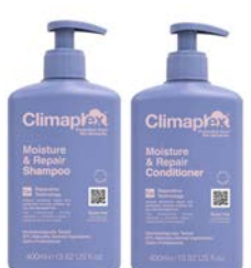
Champú 400ml Acondicionador 400ml