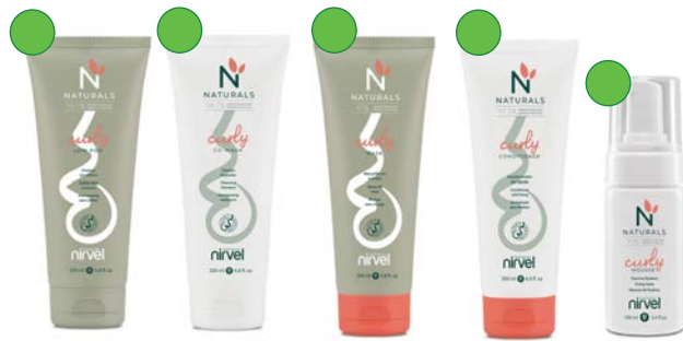
Champú lowpoo 200ml Cowash 200ml Mascarilla 200ml Acondicionador 200ml Mousse 100ml