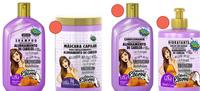
Champú 430ml Mascarilla 1kg Acondicionador 430ml Crema de peinado 320g