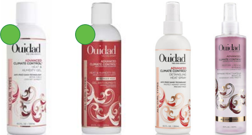
Gel fijación fuerte 250ml Spray finalizador 250ml Spray refrescar 200ml