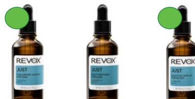
Serúm hialuronico 30ml Serúm multi proteínas 30ml Serúm ácido salicylic 30ml