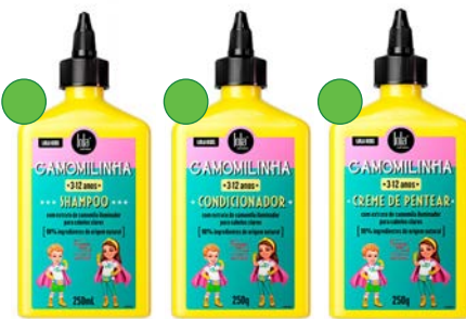
Champú 250ml Acondicionador 250g Crema de peinado 250g