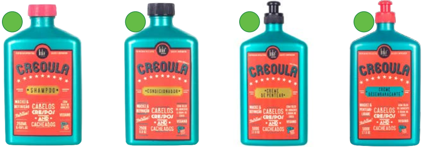
Champú 250ml Acondicionador 250g Crema de peinado 500g Crema desenredante 500g