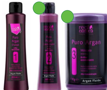
Champú 300ml Acondicionador 300ml Mascarilla 1kg