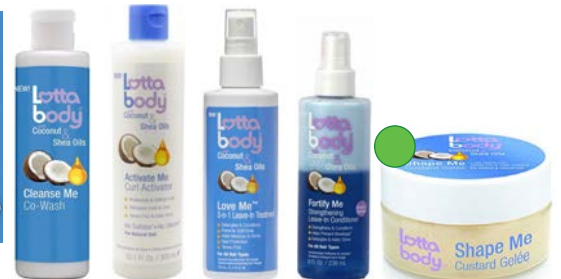
Co-wash 300ml Activador rizos 300ml Leave-in 236ml Leave-in 5en1 150ml Custard 198,4g