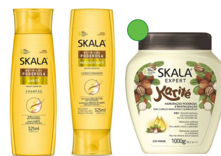
Champú 325ml Acondicionador 325ml Mascarilla 1kg