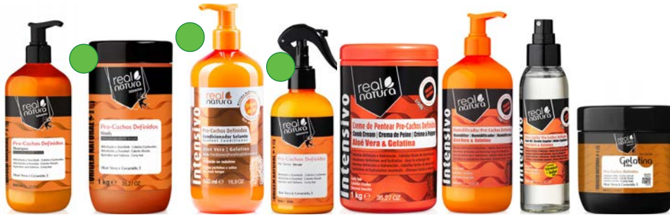
Champú 500ml Mascarilla 1kg Acondicionador 500ml Bi-Fase 300ml Crema de peinado 1kg Humidificador 500ml Aceite 100ml Gelatina 500ml