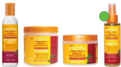
Pasta elongadora 177ml Crema elongadora 170g Gel 113g Aceite spray 118ml