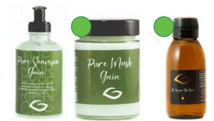
Champú 200ml Mascarilla 300ml Aceite de Argán 125ml