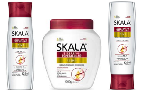
Champú 325ml Mascarilla 1kg Acondicionador 325ml