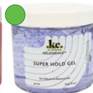
Gel super hold 455g