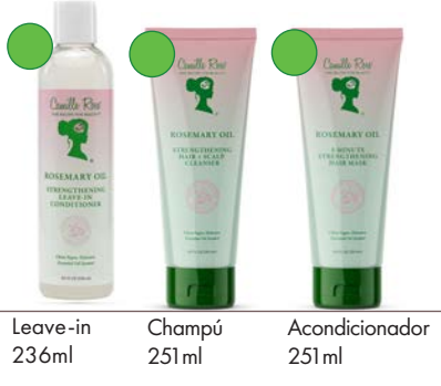
Leave-in 236ml Champú 251ml Acondicionador 251ml