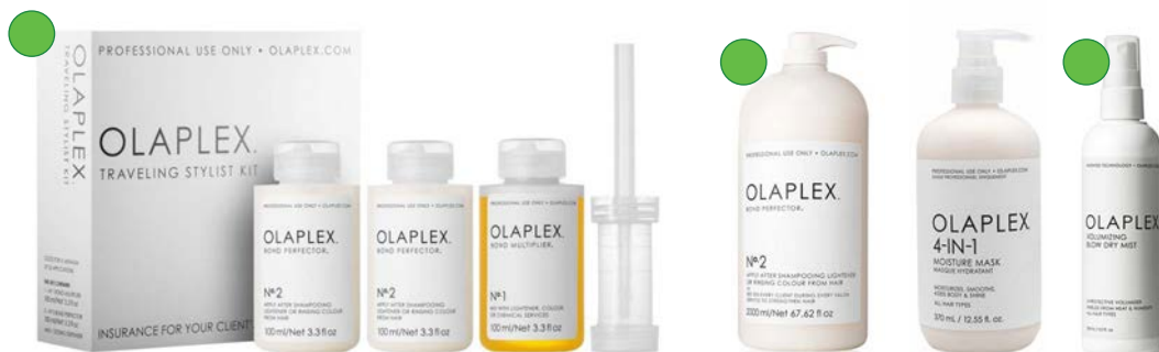
Traveling Stylist Kit (1 unidad Olaplex nº1 100ml + 2 unidades Olaplex nº2 100ml)