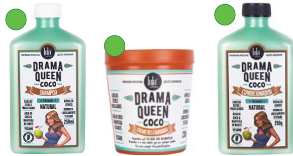
Champú 250ml Crema restauradora 230g Acondicionador 250g