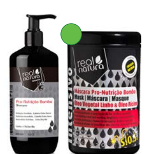
Champú 500ml Mascarilla 1kg