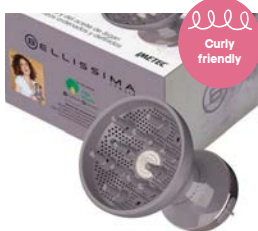
Difon DF1 2000