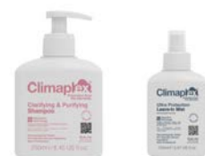
Champú 250ml Leave-in 150ml