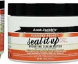
Manteca de sellado 213g