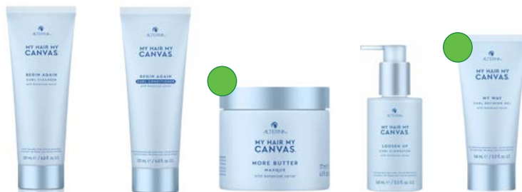
Champú 976ml/201ml /40ml Acondicionador 976ml/201ml /40ml Mascarilla 177ml/40ml Alargador de rizos 148ml Gel 148ml