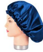
Gorro de satén anti frizz negro/ blanco/ azul