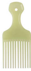
Peine ahuecador verde