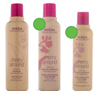
Champú 250ml/1L Acondicionador 200ml/1L Leave-in 200ml